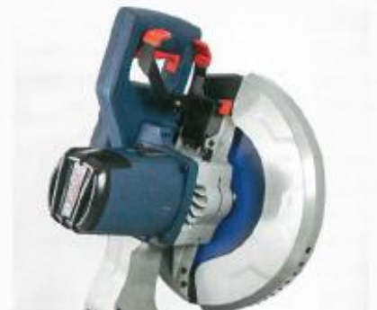
Bosch har utrustat denna maskin med en egen variant av dubbelkommando.

mycket bra till och är lätta att komma åt. Till skillnad från många av konkurrenterna har Bosch valt att byta ut muttrar och skruvar till vred och spakar med snabbkopplingar som inte kräver några verktyg för att kunna lossa eller manövrera. Mycket bra! Det sköna greppet tillsammans med ett användarvänligt dubbelkommando och lasersikte gör sågningen extra bekväm. Är du ute efter en lättanvänd och effektiv metallkap som ger ifrån sig minimalt med gnistor rekommenderar vi att du tar dig en närmare titt på Boschen. ✖