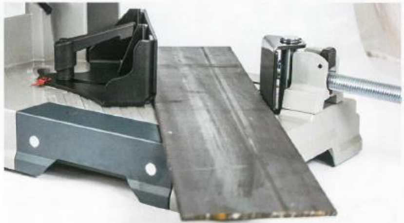
Muttrar och skruvar har ersatts med vred och snabbkopplingar som gör att det går snabbt att byta både material och vinklar när man ska kapa.

mycket bra till och är lätta att komma åt. Till skillnad från många av konkurrenterna har Bosch valt att byta ut muttrar och skruvar till vred och spakar med snabbkopplingar som inte kräver några verktyg för att kunna lossa eller manövrera. Mycket bra! Det sköna greppet tillsammans med ett användarvänligt dubbelkommando och lasersikte gör sågningen extra bekväm. Är du ute efter en lättanvänd och effektiv metallkap som ger ifrån sig minimalt med gnistor rekommenderar vi att du tar dig en närmare titt på Boschen. ✖