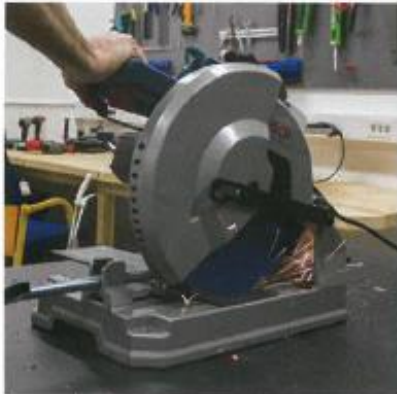
De få gnistor som Bosch ger ifrån sig samlas upp i behållaren bakom skivan.

Håller då Bosch vad de lovar: gnistfritt kapande? Svaret är "nästan". Sågar man i stål är det i princip omöjligt att undvika någon liten gnista när man sätter skivan mot materialet. Jämför man metallkaparna med keramiska kapskivor, som är direkt farliga att använda om du sågar i fel miljö, är det en ren fröjd att använda Boschen. Den har relativt låga vibrationer och är mycket effektiv. Däremot släpper den ifrån sig grova metallspån. Tack vare uppsamlingskålen som sitter bakom skivan samlas det mesta av spånet upp. Vill du ytterligare minimera risken att spånet ska flyga runt kan du ta bort uppsamlingskålen och istället koppla på en dammsugare.