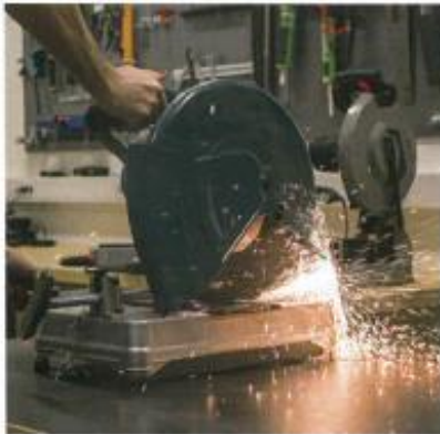
De traditionella metallkaparna ger ifrån sig ett ordentligt gnistregn.