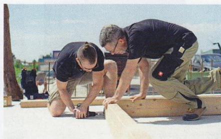
... Holz ...