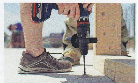
... und Beton.