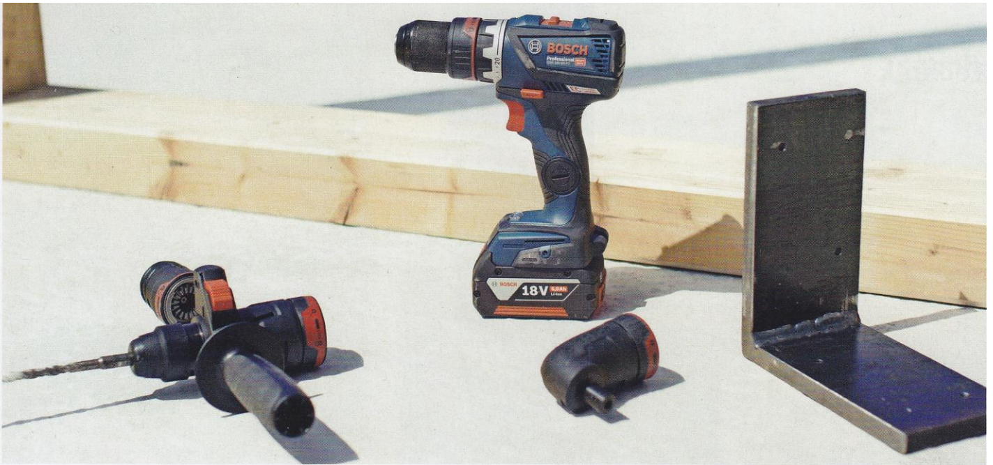
Akku-Bohrschrauber GSR 18V-60 FC Professional.