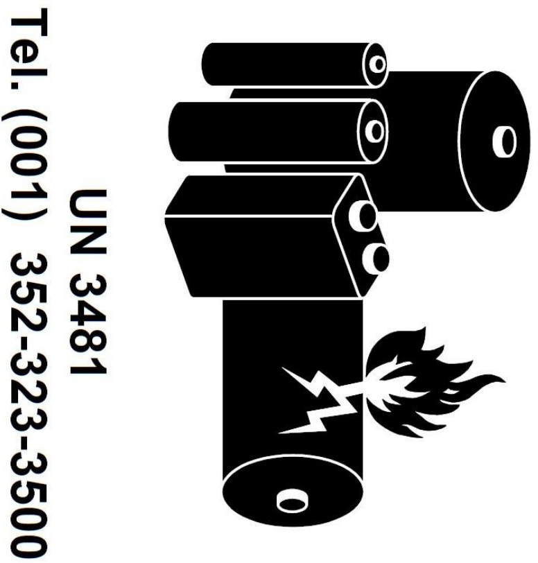
Mærkat om farligt gods med maskine