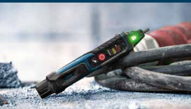
IP67: GVD 1000-17