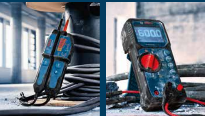
IP65: GVT 1000-15, GDM 600-15