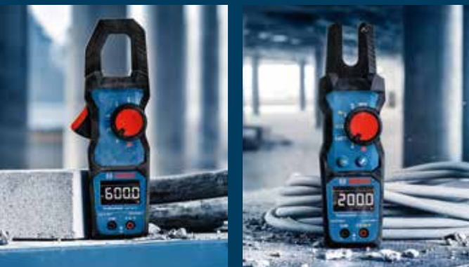
IP54: GMC 600-15, GFM 1000-15

IP ocjena ili ocjena zaštite od prodora pokazuje koliko je uređaj dobro zaštićen od prašine i vode.