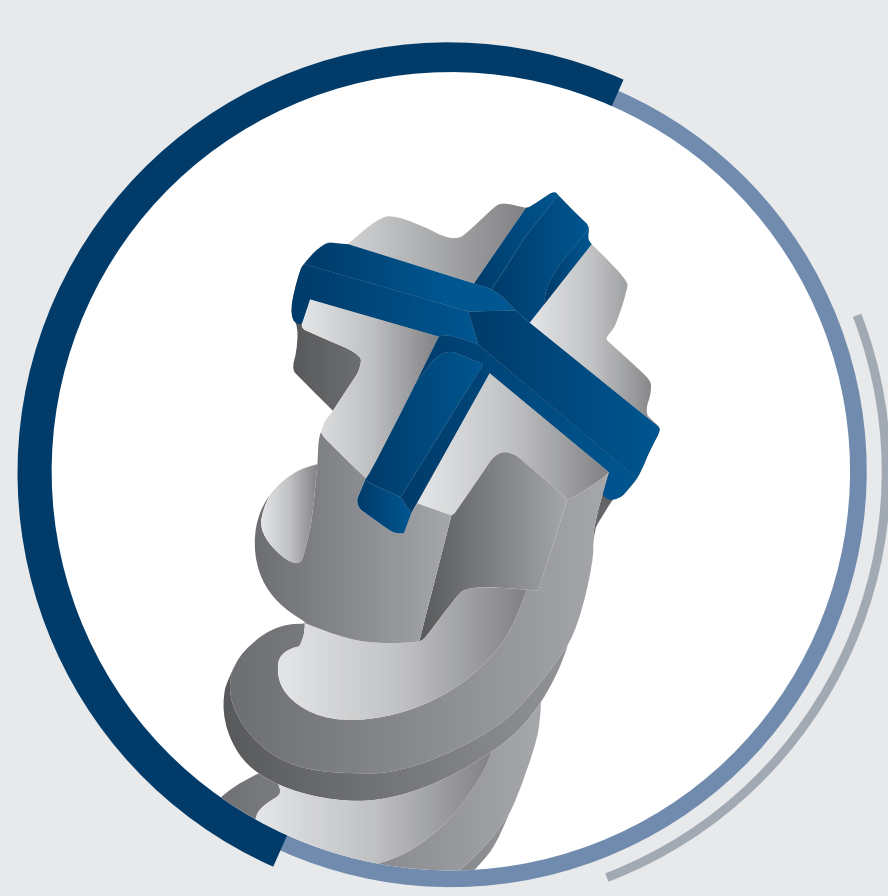
4 integrerte skjær i hardmetall

Helt hardmetallhode har ingen svakheter og utkonkurrerer 4 integrerte skjær i hardmetall